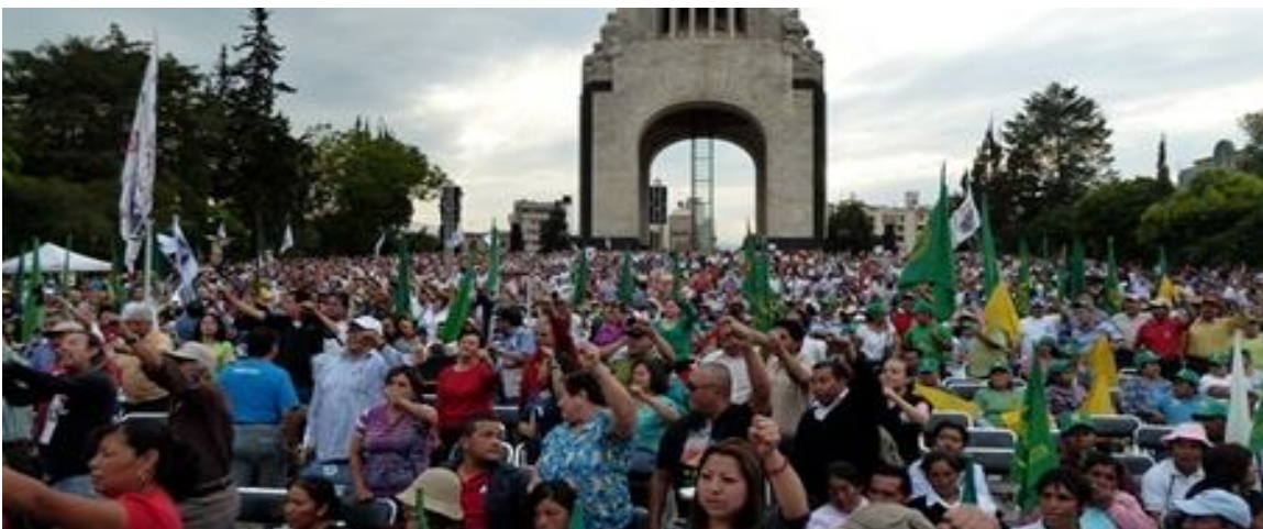
Acto de cierre Monumento de la Revolución

El acto de cierre se realizó en el monumento a la Revolución y estuvieron presentes más de 5000 compañeros/as. El multitudinario acto de cierre tuvo como invitada de honor a la senadora Colombiana Piedad Córdoba, de la Marcha Patriótica, quien felicitó a los integrantes del Sindicato Mexicano de Electricistas (SME) por la lucha de resistencia que realizan desde el 11 de octubre de 2009, exigiendo el respeto a sus derechos humanos y laborales.