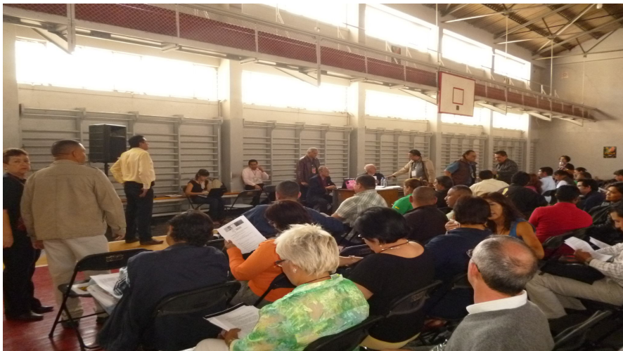
Taller Programa Formación, Investigación y asistencia técnica del ESNA